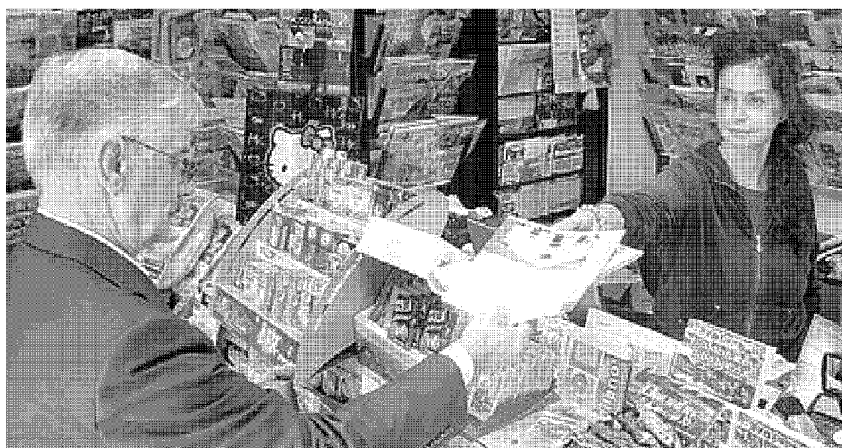
APPREZZAMENTO La consegna della scheda assieme al nostro giornale